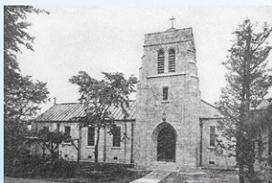
雑誌『The Spirit of Missions』 1934年5月号より 《宇都宮聖約翰教会礼拝堂全景》● 立教大学図書館蔵

上林敬吉《前橋聖マリア教会マキム主教記念礼拝堂内部スケッチ》● 1950、1951年頃 聖路加国際大学法人資料編集室蔵