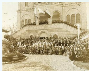
《宇都宮教会献堂式記念写真》 1932年