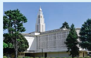
アントニン・レーモンド 《東京女子大学チャペル》● 献堂1938年

マクフィー・アンド・ダナ建築設計事務所 《立教大学礼拝堂内部透視図》 1912年 立教学院史資料センター蔵