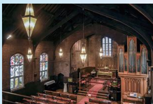
ウィリアム・ウィルソン 《川口基督教会二代礼拝堂》● 聖別1920年

ジョン・ヴァン・ウィーバーガミニニ《東京諸聖徒教会礼拝堂》撮影1931年 日本聖公会 東京諸聖徒教会蔵