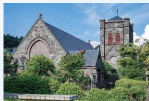
ジェームズ・マクドナルド・ガーディナー 《日光真光教会礼拝堂》● 聖別1916年