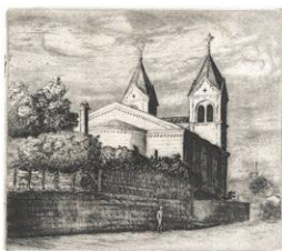
内田進久《教会》 1938年 栃木県立美術館蔵