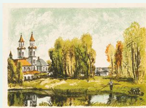
織田一磨 『画集新瀧風景』より《異人池秋景》 1929年 東京国立近代美術館蔵