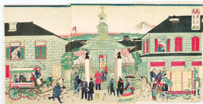
三代・歌川広重《横浜商館天主堂ノ図》 1870年 神奈川県立歴史博物館蔵