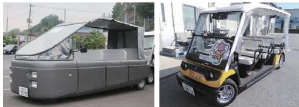
グリーンスローモビリティ